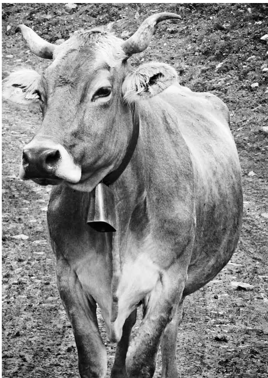
Ist die Kuh nun tatsächlich ein Klimakiller?

Am Mittwoch, 23. November, findet am Strickhof in Wülflingen der diesjährige Bio-Tag statt.